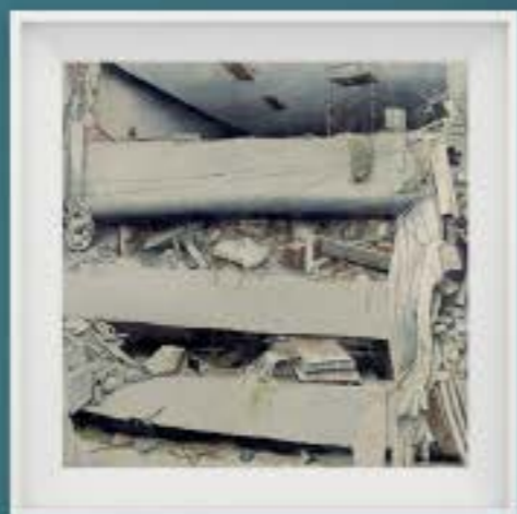
PINTURAS JUAN CHÁZARO