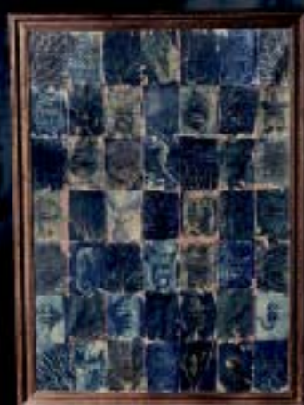
CIAN Utopía del Mar MERCEDES NAME